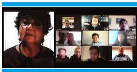
Jornada sobre "Género y Deporte" con la Profesora Dra. Dora Barrancos.

Taller "Género, Deporte y Comunicación: buenas prácticas de la comunicación libre de discriminación", INADI y periodistas partidarios.