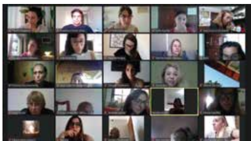
Curso "Herramientas para la prevención de violencias por motivos de género en el deporte", a cargo de los Ministerios de las Mujeres, Género y Diversidad, y Ministerio de Turismo y Deportes de la Nación.